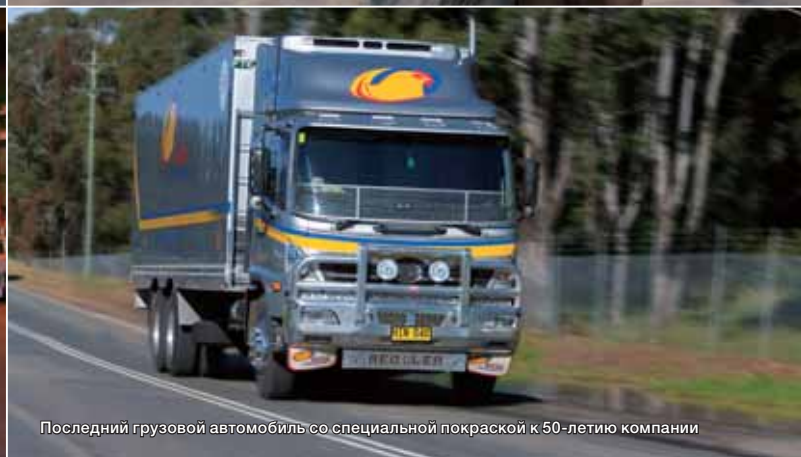
Последний грузовой автомобиль со специальной покраской к 50-летию компании

характеристик автомобиля. «В тормозных системах мы стремимся создавать чрезвычайно стойкие запчасти, которые обеспечивают достаточное и стабильное торможение для автомобилей с различной полной массой, и условиями вождения, а также обеспечить чувство легкого управления, и длительный период эксплуатации. Запчасти HINO проходят через различные испытания с целью проверки на соответствие стандартам качества HINO, и только те запчасти, которые пройдут эти испытания по оценке качества и все производственные процессы, могут попасть в сеть продаж». Зная только это вы можете получить представление о производственном процессе HINO и ноу-хау, основанных на технологиях. Даже после того, как произведен запуск на рынок, ведется мониторинг с целью получения обратной связи от клиентов, список потребностей которых постоянно расширяется. Эта обратная связь в дальнейшем учитывается при разработке с целью дальнейшего усовершенствования запасных частей.