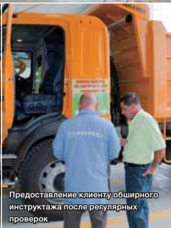
Предоставление клиенту обширного инструктажа после регулярных проверок