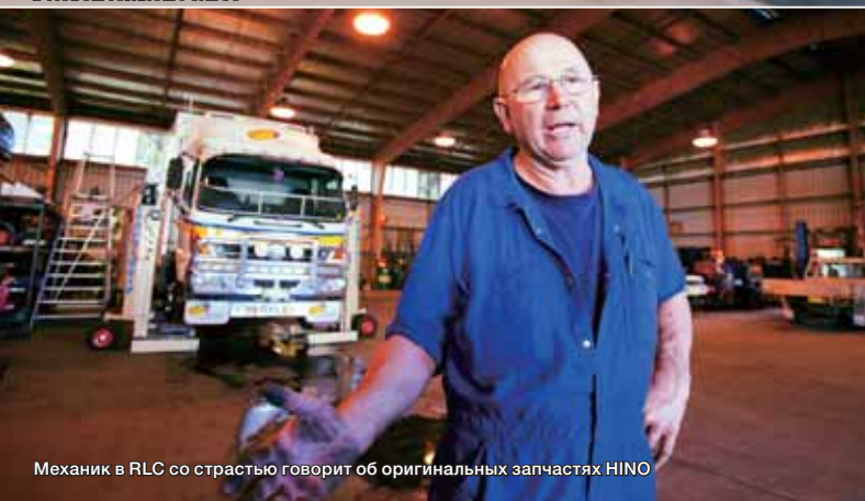
Механик в RLC со страстью говорит об оригинальных запчастях HINO