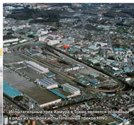
Испытательный трек Хамура в Токио является основным в ряду из четырех испытательных трекх HINO