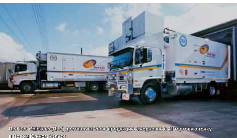
Red Lea Chickens (RLC) доставляет свою продукцию ежедневно в 41 торговую точку в Новом Южном Уэльсе

«В HINO, мы стремимся создать конкретные характеристики наших автомобилей для различных рынков и моделей, а также разработать оригинальные запчасти, которые будут соответствовать требованиям клиентов. В этом смысле можно сказать, что оригинальные запчасти HINO, полностью отличаются от неоригинальных запчастей, доступных на рынке». Это является хорошей иллюстрацией духа и страсти, которые HINO вкладывает в разработку даже самой маленькой запчасти. Мы полагаем, что это и есть причина