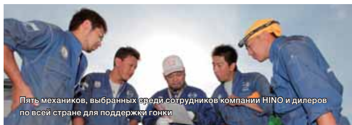
Пять механиков, выбранных среди сотрудников компании HINO и дилеров по всей стране для поддержки гонки

Во всем мире происходит много разных событий, которые помогают нам больше узнать о HINO.