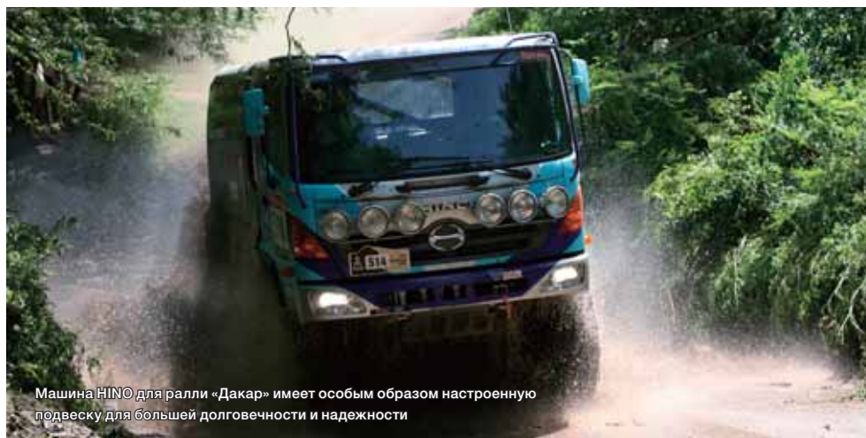
Машина HINO для ралли «Дакар» имеет особым образом настроенную подвеску для большей долговечности и надежности