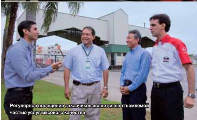
Регулярное посещение заказчиков является неотъемлемой частью услуг высокого качества

частей HINO, если они нуждаются в замене. В дополнение к проверкам, которые мы предоставляем бесплатно на первые 1000 км и 5000 км пробега, мы также рекомендуем регулярное прохождение технического обслуживания через каждые последующие 5000 км пробега. Мы полагаем, что выполнение этих рекомендаций помогает нашим клиентам предотвратить неисправности до того, как они произойдут. Таким образом не удивительно, что грузовой автомобиль HINO, который регулярно проверяли и о котором заботились, выполняя соответствующие работы по техническому обслуживанию, провел на дороге 1 миллион километров без капитального ремонта двигателя. Я полагаю, что в мире есть еще много таких автомобилей HINO как этот».