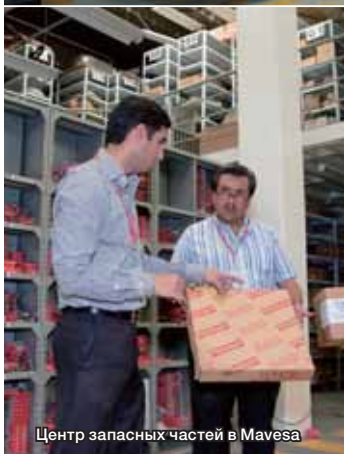
Центр запасных частей в Mavesa