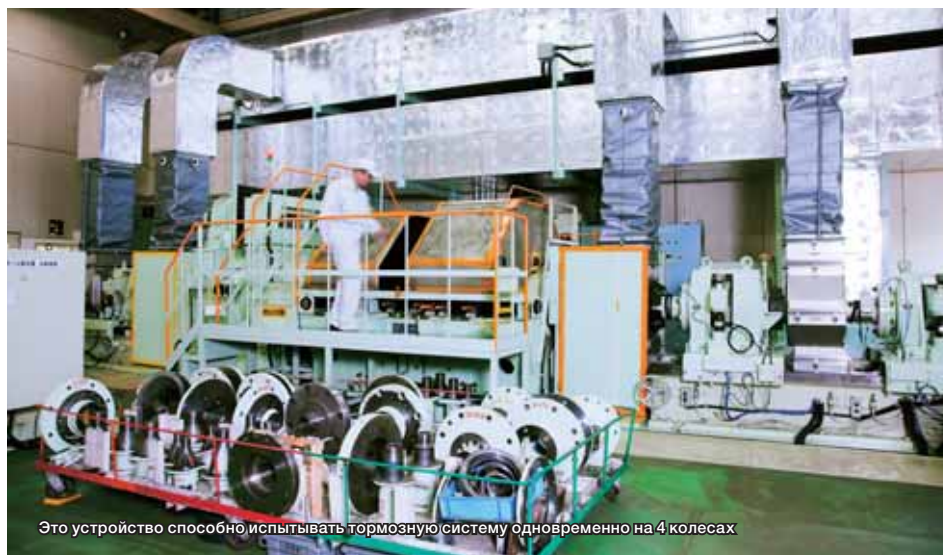
Это устройство способно испытывать тормозную систему одновременно на 4 колесах

Компания осуществляет свою деятельности с 1980 года, имея на сегодняшний день в автопарке 29 автомобилей HINO. Механики в Red Lea Chickens также хвалят оригинальные запчасти HINO: «Мы когда-то использовали неоригинальные тормозные накладки, но они создавали ужасный шум при торможении, и мы должны были менять их раньше, чем оригинальные накладки HINO. В действительности есть много различий между качеством оригинальных запчастей и неоригинальных. Вот почему мы больше