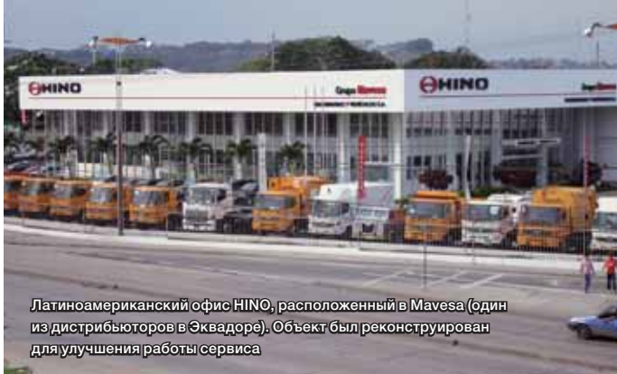
Латиноамериканский офис HINO, расположенный в Mavesa (один из дистрибьюторов в Эквадоре). Объект был реконструирован для улучшения работы сервиса