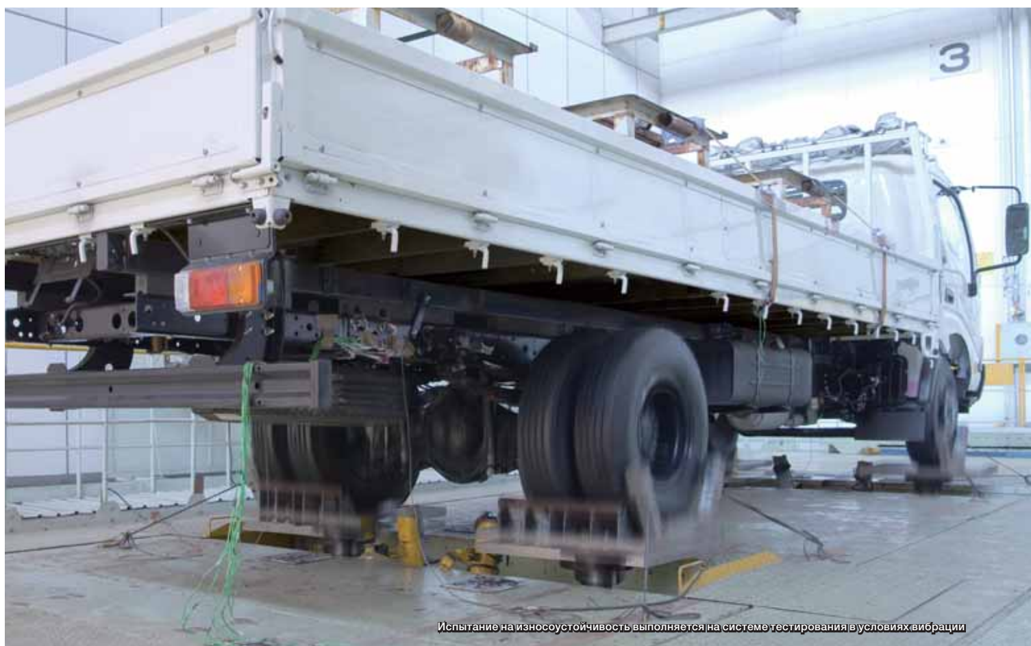
Испытание на износоустойчивость выполняется на системе тестирования в условиях вибрации