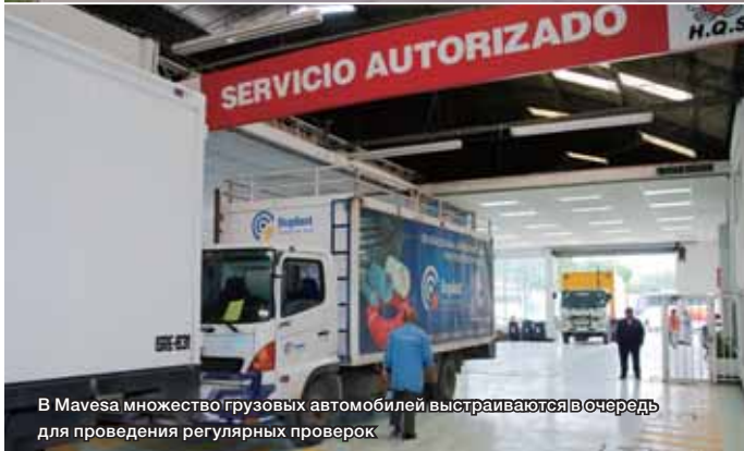
В Mavesa множество грузовых автомобилей выстраиваются в очередь для проведения регулярных проверок