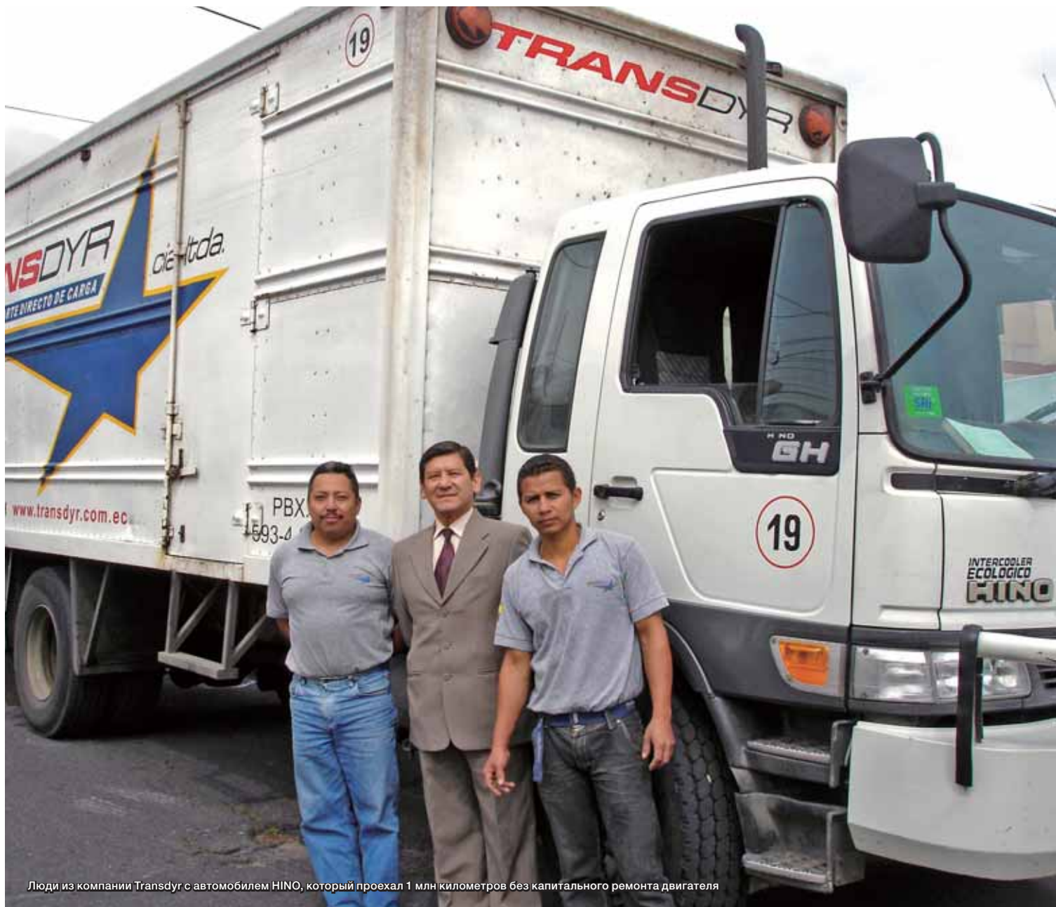
Люди из компании Transdyr с автомобилем HINO, который проехал 1 млн километров без капитального ремонта двигателя

и дорожных условий, в которых используются автомобили, грузовым автомобилям дальнего следования обычно требуется проведение капитального ремонта при показаниях одометра около 700 000–800 000 километров. В этом смысле грузовые автомобили HINO в компании Transdyr, которые проехали более чем 1 миллион километров без капитального ремонта двигателя, являются редким случаем. Это, кажется, не удивляет Главного менеджера латиноамериканского офиса, г-на Юиси Сато. Г-н Сато говорит: «Мы постоянно напоминаем нашим клиентам о важности ежедневных проверок, и использования оригинальных запасных